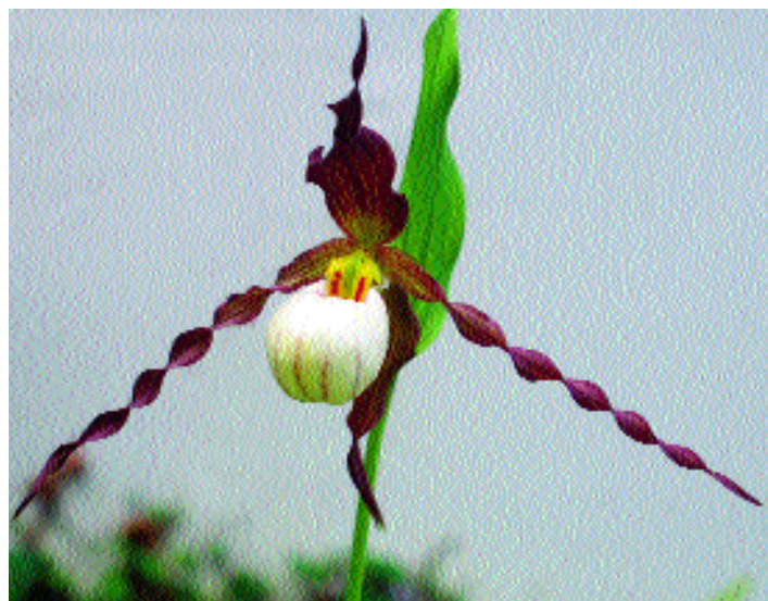
Cypripedium 'Sebastian' fällt besonders durch ihre gedrehten Petalen auf. Le Cypripedium 'Sebastian' plaît particulièrement avec ses pétales torsadés.

Standort: Im Allgemeinen bevorzugen Dactylorhiza sonnige Plätze, doch gedeihen sie auch an einer leicht schattigen Lage.